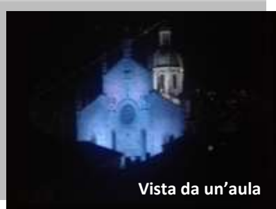
Vista da un'aula

Ogni nostro corso concluso con esito positivo assicura ai partecipanti l'esclusivo certificato inlingua, titolo preferenziale presso qualsiasi azienda pubblica e privata in Italia e all'estero. Tutti i nostri corsi, iniziati in un centro inlingua in Italia, possono essere proseguiti in qualsiasi altra sede inlingua in Italia o nel mondo.