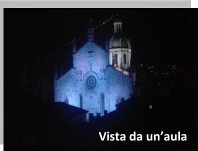
Vista da un'aula

Ogni nostro corso concluso con esito positivo assicura ai partecipanti l'esclusivo certificato inlingua, titolo preferenziale presso qualsiasi azienda pubblica e privata in Italia e all'estero. Tutti i nostri corsi, iniziati in un centro inlingua in Italia, possono essere proseguiti in qualsiasi altra sede inlingua in Italia o nel mondo.